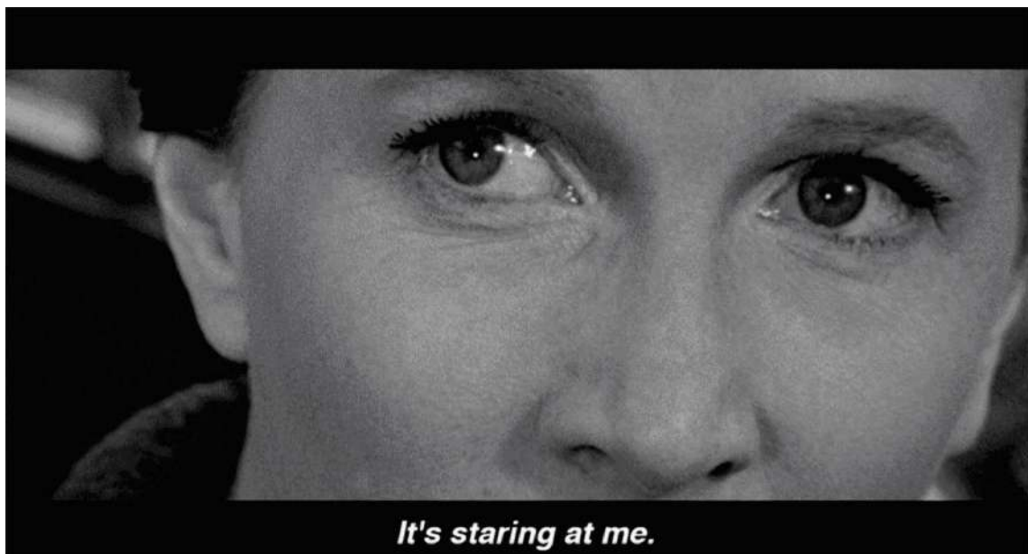
Wise, Robert (director). (1963) The haunting [película]. Metro-Goldwyn-Mayer.